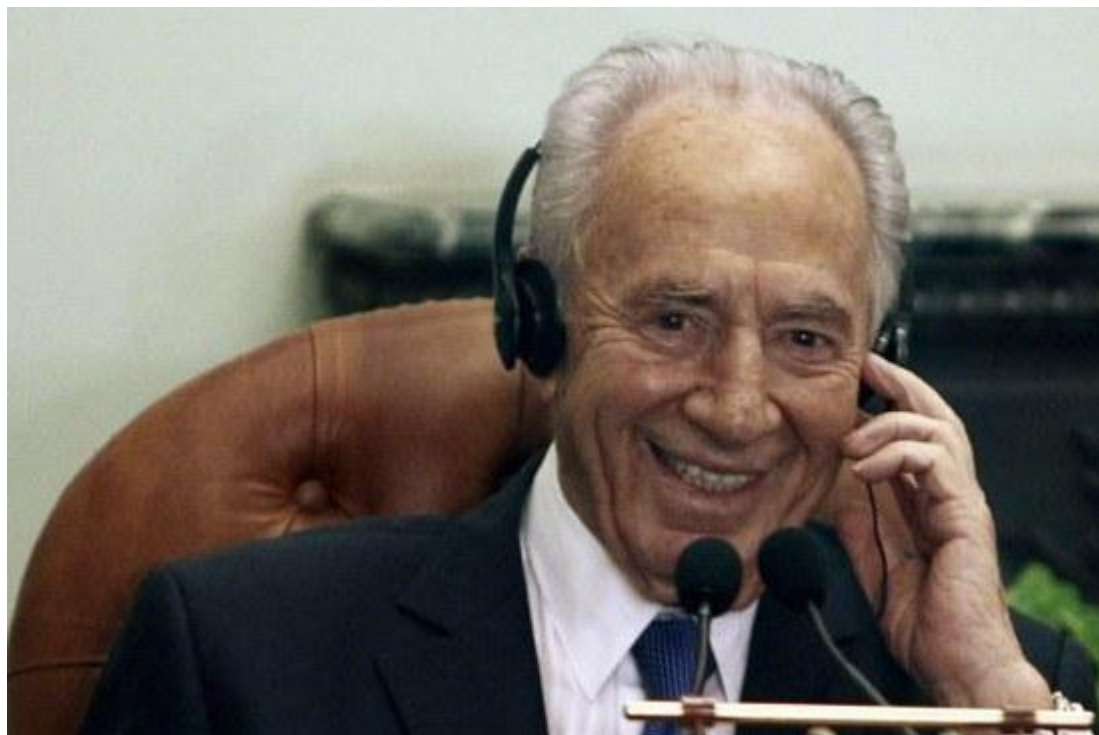
Shimonas Peresas, Izraelio prezidentas