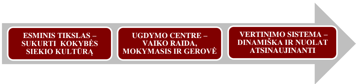
2 pav. Mokyklos veiklos kokybės vertinimo pagrindinės vertybinės nuostatos

Visa ikimokyklinio ir (ar) priešmokyklinio ugdymo programos vykdančios mokyklos veiklos kokybės vertinimo sistema remiasi trimis pagrindinėmis vertinimo nuostatomis (2 pav.). Jos yra esminės ir mokyklos bendruomenei, dalyvaujantys įsivertinimo procese.